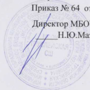
ГРАФИК ОЦЕНОЧНЫХ ПРОЦЕДУР на 2025-2026 учебный год